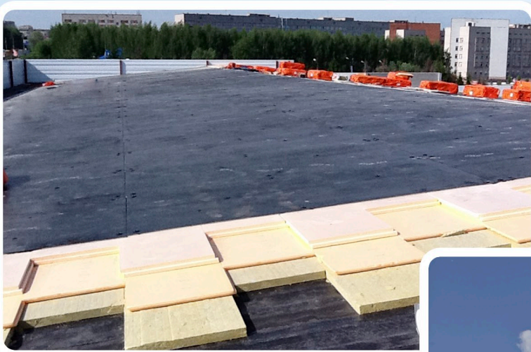
Наплавляемая кровля на здании автосалона «ЛеоСмарт Центр» г.Ижевск